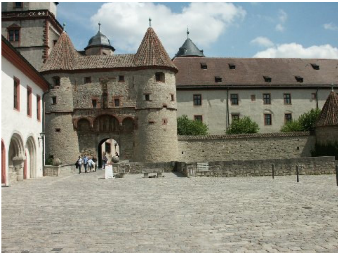
Scherenbergertor- Zugang zum Kernschloss

Unübersehbar überragt die mächtige Festung Marienberg die Stadt Würzburg und den Main und macht dem Namensteil „Burg“ in Würzburg alle Ehre. Einst keltische Befestigung, später Burg, dann Burgschloss, wurde die Anlage zur Festung ausgebaut und kann mit anderen süddeutschen Festungen wie der Wülzburg 1 , Plassenburg 2 , Hochburg 3 , Hohenneuffen 4 und Hohenasperg 5 verglichen werden.