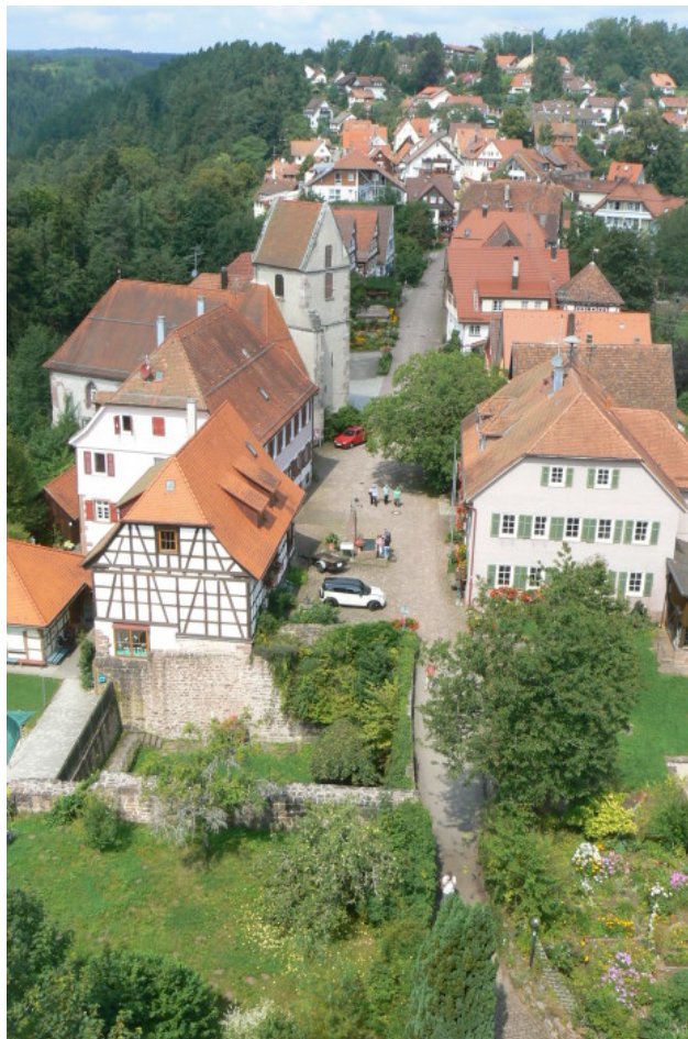
Bergsporn vom Bergfried gesehen (unten 1. Graben und Vorburg)

Hoch über Bad Teinach liegt das Städtchen Zavelstein – heute ein Ortsteil von Bad Teinach. Auf dem nach Südosten schmal über das Tal ragenden Bergsporn – „Schlossberg“ genannt- befindet sich die Burgruine, welche vom alten Ortskern Zavelstein wie von einer Vorburg geschützt wird. Der Name Zavelstein stammt vom alten Begriff für Schachbrett: „Schachzavel“. Das Schachbrett ziert auch das Wappen der einstigen Burgherren.