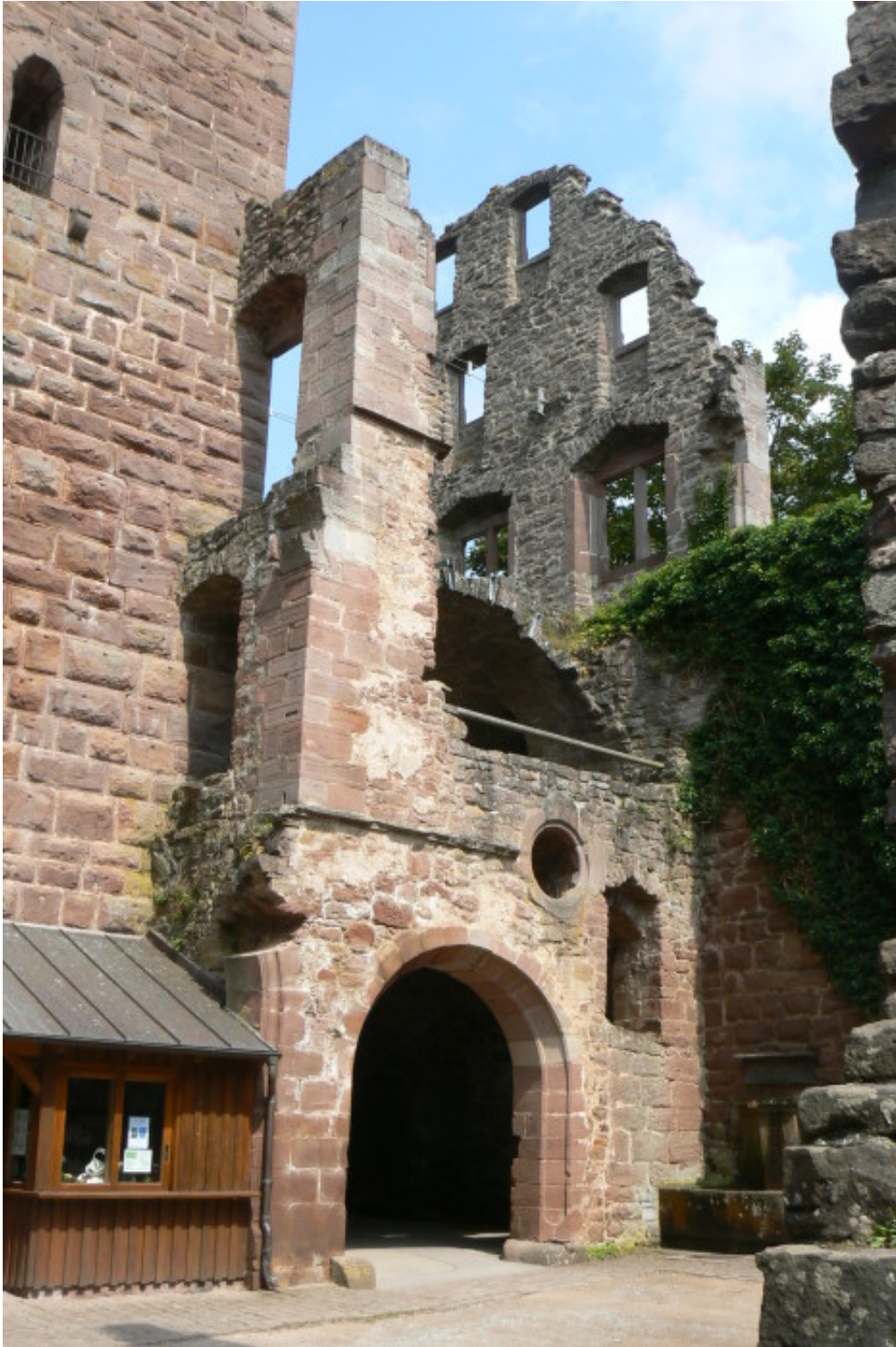
Torbau vom Hof gesehen, links der Bergfried

wurden Burg und Herrschaft von Herzog Johann Friedrich an die Freiherren Buwinghamen von Walmerode übergeben, welche die Burg 1620 vollständig erwarben. Diese erneuerten die Anlage durch den Baumeister Schickhardt zum Renaissanceschloss.