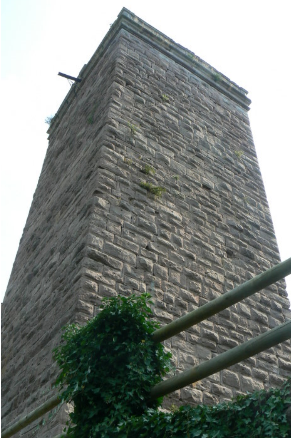
Bergfried vom Zwinger aus gesehen

gemauerter Halsgraben. Beide Gräben sind mit seitlichen Mauern als Grabensperren geschützt. Heute führt anstelle der einstigen Zugbrücke eine gemauerte Brücke zur Kernburg. Der Besucher betritt den Zwinger, welcher der Form des Bergspornes folgend die Kernburg als längliches 5-Eck umgibt. An der Nordwestspitze des Zwingers finden wir den quadratischen Rest eines turmähnlichen Gebäudes.