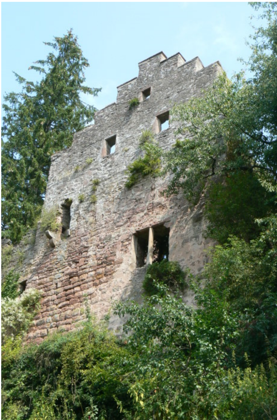
Westlicher Treppengiebel im „Alten Bau“