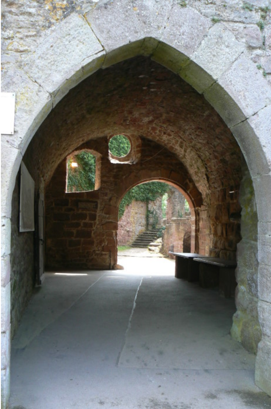
Gewölbezugang in die Kernburg

Der Besucher nähert sich vom Städtchen Zavelstein der Burg auf dem Bergsporn durch die alte westliche Stadtmauer, die wie eine Vorburg den alten Stadtkern und die Burg auf dem Bergsporn schützt. Vorbei an malerischen kleinen Häuschen und an der um 1200 als Wehrturm mit Kapelle errichteten Kirche, in welcher Grabsteine der Freiherren von Bouwinghausen-Wallmerode zu finden sind, führt der Weg zur Burg. Nach der östlichen Stadtmauer folgt der erste, gemauerte Halsgraben, danach das heute unbebaute kleine, rechteckige Plateau der Vorburg. Darauf folgt ein weiterer,